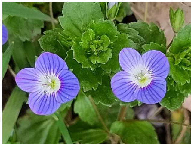
... und Persischer Ehrenpreis

Das gibt es nur, weil wir den Salat überwintert haben. Da verschiedene Sorten zu unterschiedlichen Zeitpunkten und sowohl im Tunnel als auch im Freiland gepflanzt wurden, wird es in den kommenden Wochen immer frischen Salat geben. Übrigens – im Freiland halten die Salate in der Regel deutlich niedrigere Temperaturen aus als man erwarten würde – mindestens bis zu -11°C. So viel mussten sie diesen Winter bei uns mal aushalten. Den Salat bedeckt man außerdem am besten nicht mit einem Vlies, da er große Temperaturschwankungen nicht so gut verträgt (unter dem Vlies kann es bei Sonnenschein schon mal lauschig werden).