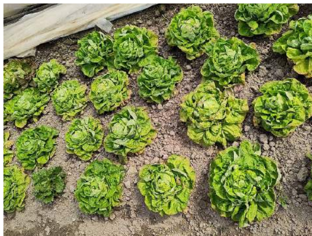
Kopfsalat bereits im März!

In den Tunneln sind die Asia-Salate bereits in Blüte gegangen und auch den großen Kopfsalaten wurde es zu warm und sie mussten geerntet werden.