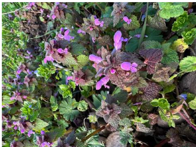
Wildkräuter auf dem Walzbachacker: Purpurrote Taubnessel...

Vor allem durch die sonnenreichen Stunden, verbunden mit dem Längerwerden der Tage, hat sich auf dem Acker viel getan: überall fangen Gemüse- und auch Wildpflanzen an zu wachsen oder zu blühen.