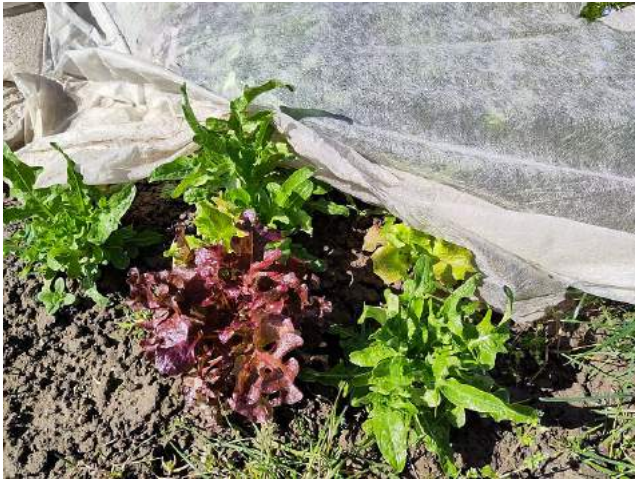
Weg mit der Deckel!

Mit ein paar Ausfällen muss man bei überwinterten Salaten rechnen, da sie sehr lange (teilweise sogar über ein halbes Jahr) im Beet stehen und den Umwelteinflüssen ausgesetzt sind. Die Verluste auf unserem Acker würde ich mehr den Fraßschäden (Nutra? Feldmaus?) als den Frostschäden zuordnen.